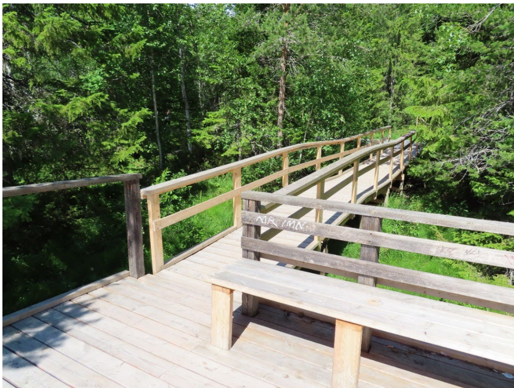
Figur 7. Lillsjön fågelspaningsterrass 2021.

Vid platsbesöket 2021 observeras även skyltningen vid platsen. Det finns flera skyltar med information om naturreservatet, men vars tillgänglighet är oklar både vad det gäller text och placering (figur 6).