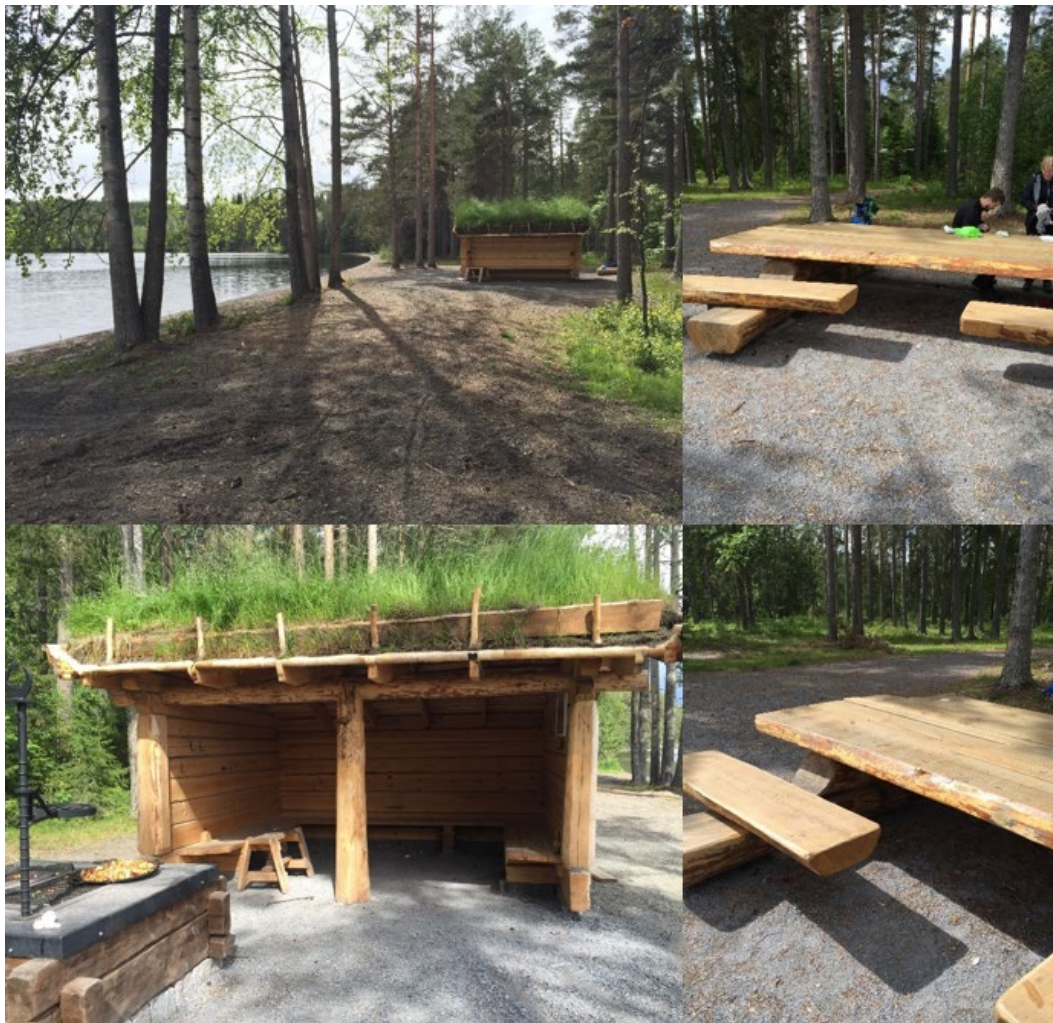
Figur 12. Vindskydd vid Bynäset 2019.

Bland annat studerades naturreservatet Andersön, vilket är ett av kommunens mest besökta naturområden. Till följd av slitage av vandring och cykling har Länsstyrelsen inför sommaren 2019 preparerat de mest använda lederna för att skydda rötter från slitage på grund av miljöskäl. Samtidigt gjorde skyddet också området mer framkomligt, se figur 11.