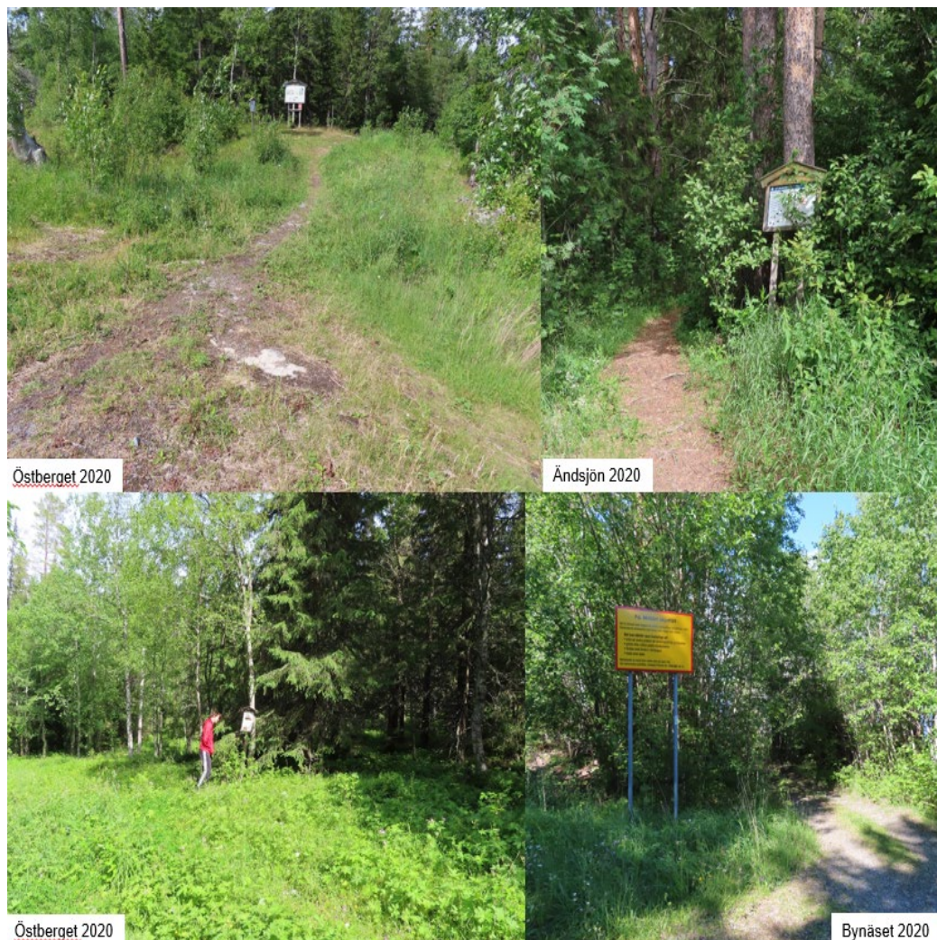
Figur 13. Olika exempel på skyltar för naturområden Östersund.

År 2018 invigdes ett tillgänglighetsanpassat vindskydd vid friluftsområdet Bynäset (figur 12). Vindskyddet ligger ett par hundra meter från parkeringen, med en grusgång. Det går enkelt att komma in i vindskyddet samt att sittplatserna vid bordet går att justera.