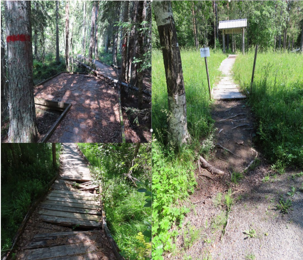
Figur 8. Lillsjön träramp 2021.

Vid platsbesöket 2019 finns en delvis tillgänglighetsanpassad brygga samt en trallpreparerad fågelspaningsterrass, men de är i tveksamt skick på grund av trasiga plankor. Fågelspaningsterassen har vid platsbesöket 2021 renoverats, se figur 7.