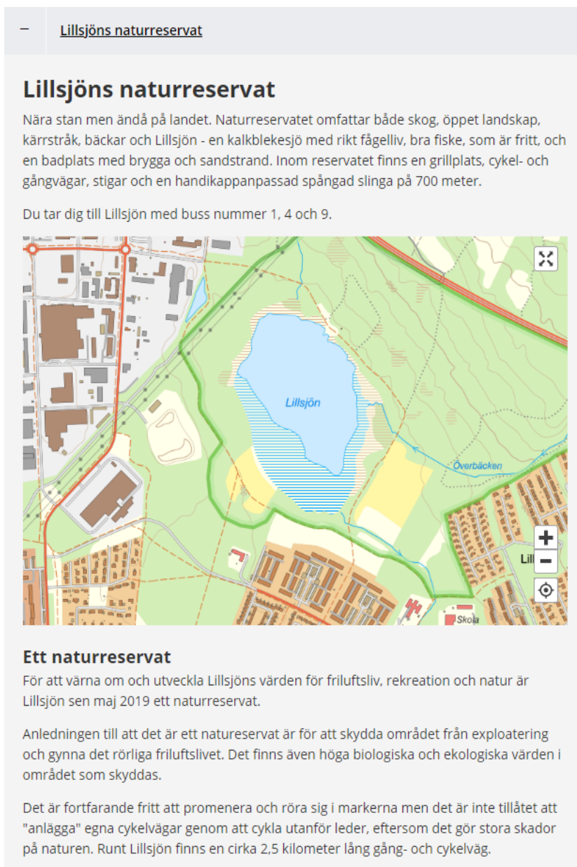
Figur 9. Lillsjön och information på Östersunds kommuns webbsida.

Vi konstaterar efter platsbesöken att den digitala informationen tyvärr inte alltid överensstämmer med verkligheten. Att trärampen har varit avstängd sedan 2017 anges exempelvis inte på kommunens egen webbsida under "Parker och utflyktsmål" (figur 9, april 2021 samt när vi följer upp detta igen i mars 2022) där följande beskrivning finns: "Nära stan men ändå på landet. En handikappanpassad spångad slinga på 700 m guidar dig igenom det typiskt centraljämtländska landskapet." Tillgänglighet beskrivs inte generellt utan fokus är främst på naturvärden och att det är ett skyddat område.