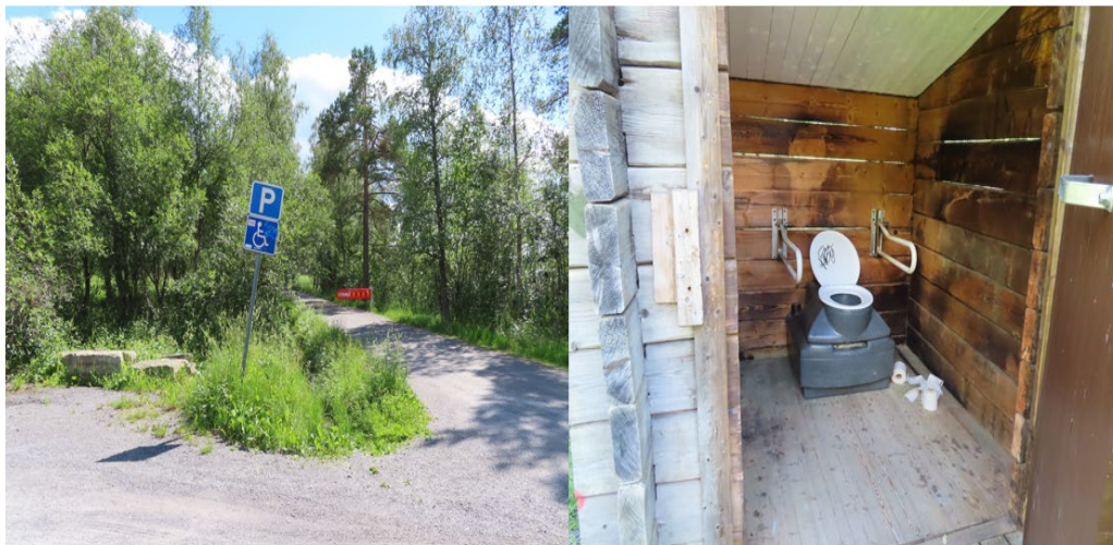
Figur 4. Lillsjön parkering och toalett 2021.

År 2019 finns i anslutning till parkeringen ett tillgänglighetsanpassat utedass. Parkering ligger alldeles intill rastplatsen vid Lillsjön, men tillgängligheten är sedan begränsad med en bom. Om man kommer förbi den, är istället närmsta parkering ca 200 meter bort vid själva badplatsen. Vid återbesöket sommaren 2021, har det inte skett några förändringar gällande parkeringsmöjligheterna. I anslutning till parkeringen finns fortfarande ett utedass, se figur 4.