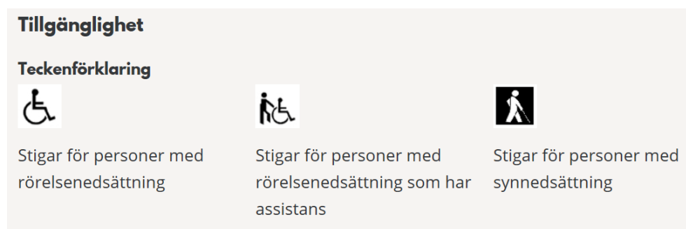
Figur 14. Teckenförklaring för tillgänglighet Örebro kommuns natur- och kulturresevat.

Samtidigt konstateras att appen, som bara är applicerbar för Iphone, kanske inte är den bästa. Den blev ganska ”tung” på grund av alla funktioner, enligt den intervjuade.