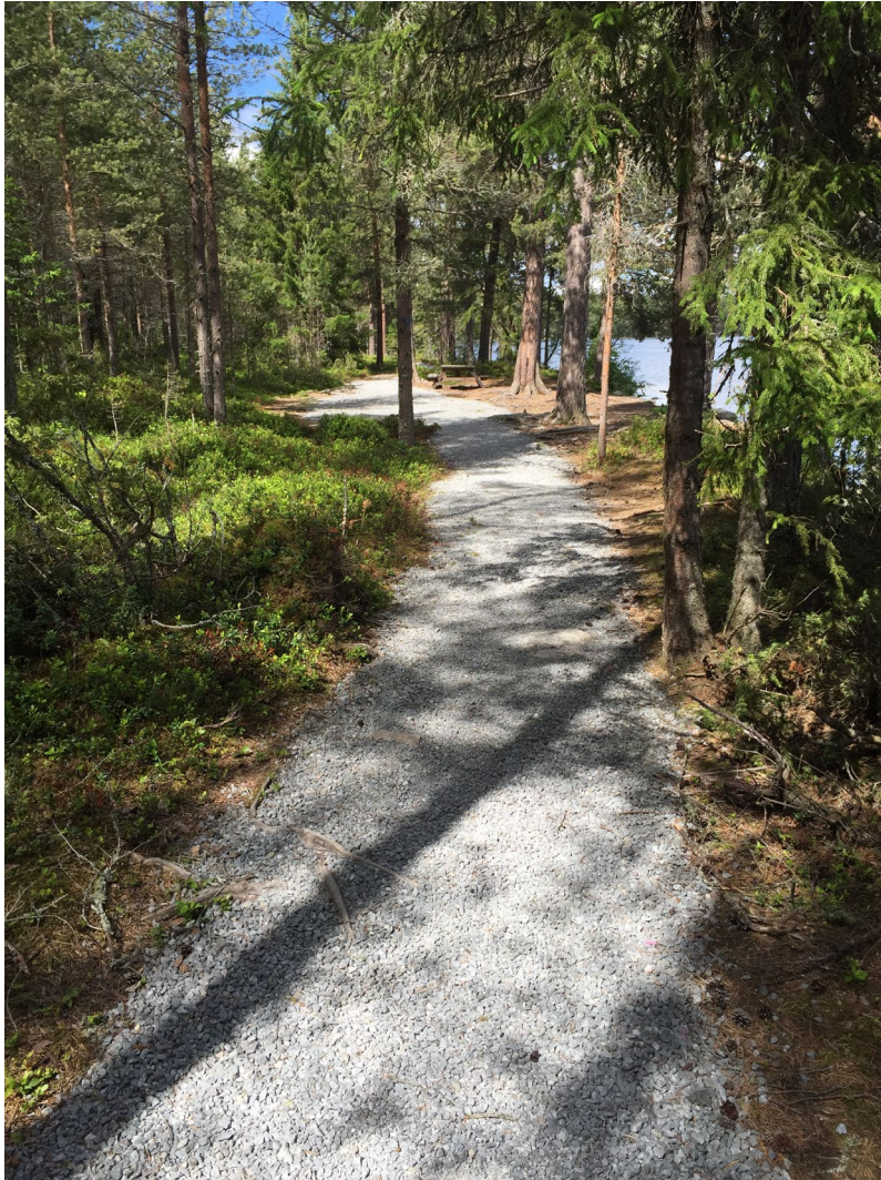
Figur 11. Grusad gång i naturreservat Andersön 2019.

Det observeras också vid platsbesöken att en del av en väg eller led kan vara preparerad, men att det sedan saknas några meter av tillgänglighet till att kunna ta sig till själva stranden eller till en plats med vacker utsikt. Tillgängligheten går inte hela vägen fram. Detta observeras bland annat vid Frösö Skans, som har en parkeringsplats följt av en närmast otillgänglig stig.