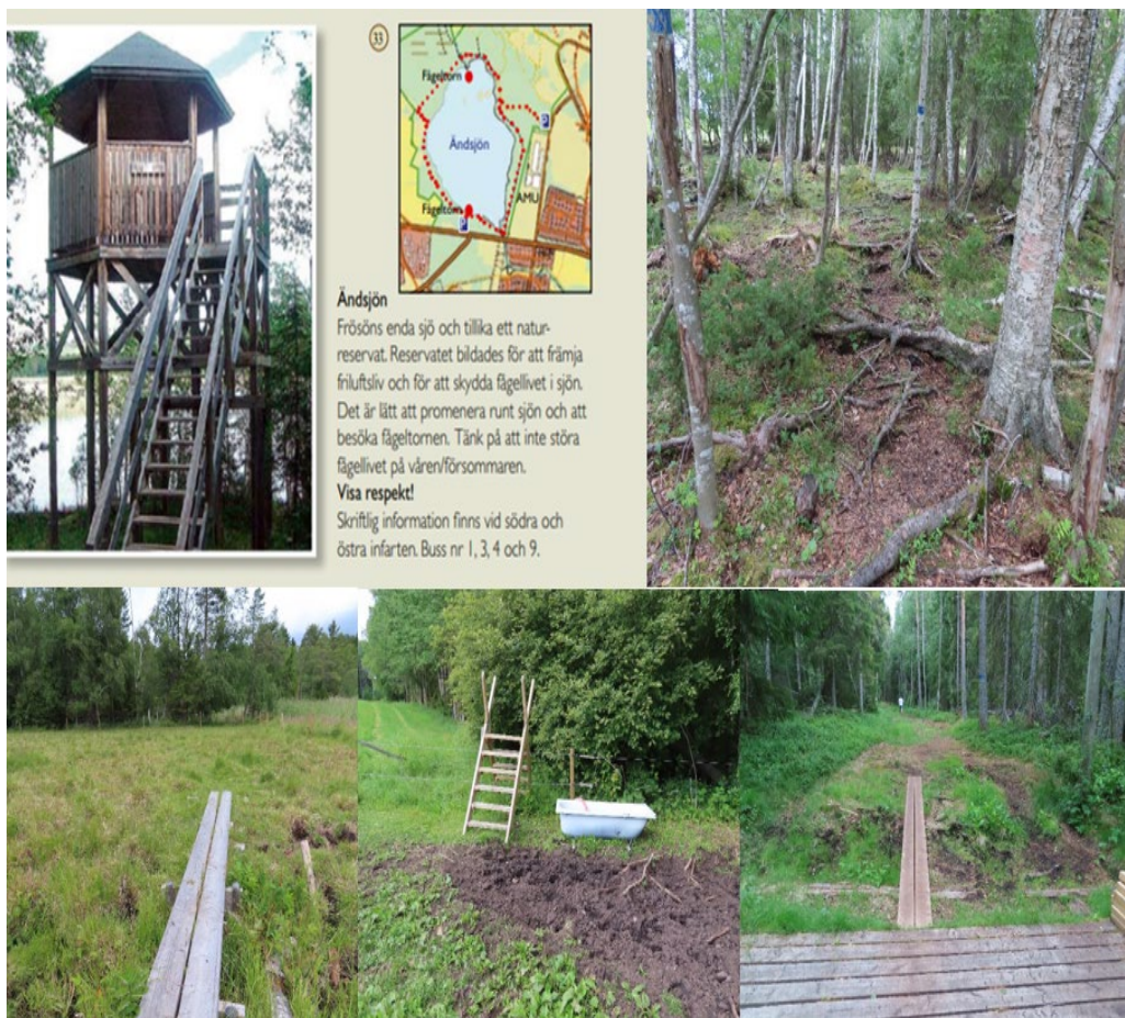
Figur 3. Tillgängligt och "lätt att promenera runt" – Ändsjön.

Slutligen, vad som beskrivs, uppfattas eller upplevs som tillgängligt i webbsidornas information kan också skilja sig från individens faktiska möjligheter och förutsättningar. Till exempel naturreservatet Ändsjön i broschyren " Skogs- och naturpärlor runt Östersund " beskrivs som "lätt att promenera runt". Men platsbesöket påvisar olika utmaningar gällande tillgänglighet och möjligheterna att ta sig runt sjön, se de olika bilderna av spänger, rötter och kohage i figur 3.