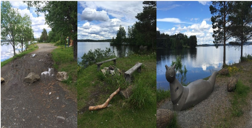
Figur 2. Storsjödjursspaning i Sunne.

Ytterligare så har varje länsstyrelse på sin webbsida en sökmotor på webb och för mobil gällande besöksmål i hela landet. Genom sökmotorn är det möjligt att göra utsökningar efter län, kommun samt serviceinformation bland annat relaterad till tillgänglighet. Även naturtyp är en filtrering man kan använda. När vi prövade filtrering med service och "tillgänglighet" för Östersunds kommun, kom två naturreservat upp som alternativ: Andersön och Tysjöarna. Andersön beskrivs i löptext under en rubrik "Lätt att åka dit" som ett lämpligt reservat att besöka om man använder rullstol. I en informationsruta "Tillgänglighet" anges att det finns torrpass, rastplatser och vindskydd som underlättar ett aktivt friluftsliv i området. Tysjöarna är tillgängligt med rullstol från ingången via Krokoms kommun.