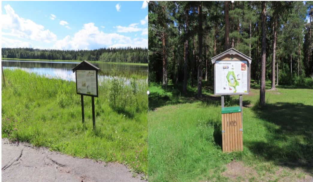
Figur 6. Lillsjön skyltning 2021.

Vid platsbesöket 2021 observeras även skyltningen vid platsen. Det finns flera skyltar med information om naturreservatet, men vars tillgänglighet är oklar både vad det gäller text och placering (figur 6).