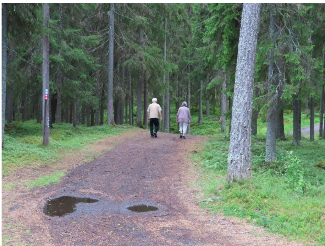
Figur 1. Personer på promenad på Östberget i Östersund.

Flera av de intervjuade beskriver hur de varierar mellan att vara ute i naturen själva eller tillsammans med någon. Sällskap betraktas som trevligt och roligt ur en social aspekt, till exempel en promenad med en vän eller med den lokala pensionärsföreningen. Med tanke på att flera intervjuade kontaktades via pensionärsföreningar finns det flera exempel på hur det sociala sammanhanget ger ett stödande sammanhang både när det gäller arrangerade aktiviteter (som promenader eller utflykter), men också när det gäller en inkluderande atmosfär där nivån på utmaningen i aktiviteten, till exempel tempo och terräng, anpassas efter alla deltagare.