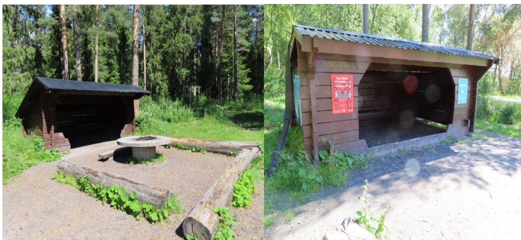
Figur 5. Lillsjön vindskydd 2021.

År 2019 finns i anslutning till parkeringen ett tillgänglighetsanpassat utedass. Parkering ligger alldeles intill rastplatsen vid Lillsjön, men tillgängligheten är sedan begränsad med en bom. Om man kommer förbi den, är istället närmsta parkering ca 200 meter bort vid själva badplatsen. Vid återbesöket sommaren 2021, har det inte skett några förändringar gällande parkeringsmöjligheterna. I anslutning till parkeringen finns fortfarande ett utedass, se figur 4.